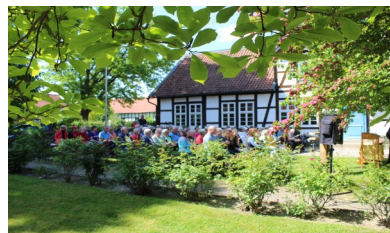
Himmelfahrt 2024 in Liebenburg

Dieses Jahr treffen sich alle Kirchengemeinden aus unserem Kirchengemeindeverband Liebenburg wieder am Himmelfahrts- tag, dem 14. Mai