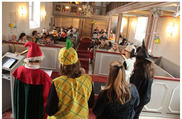
FamGo in Dörnten- Halleluja und Hellau - mit Verkleidung