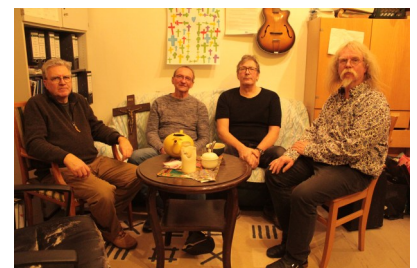
Mit dabei: „Die Hausband“

Alle sind herzlich dazu eingeladen. Der Eintritt ist frei, um eine Spende wird gebeten. Auch für das leibliche Wohl wird gesorgt.