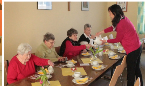
Weltgebetstag in der St. Joseph Kirche Othfresen - echt ökumenisch, danach gab es leckeren Kuchen!