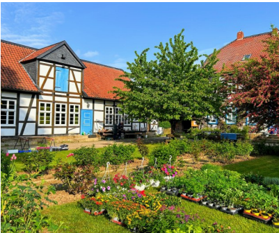
Gartenflohmarkt 2025 auf dem Pfarrhof