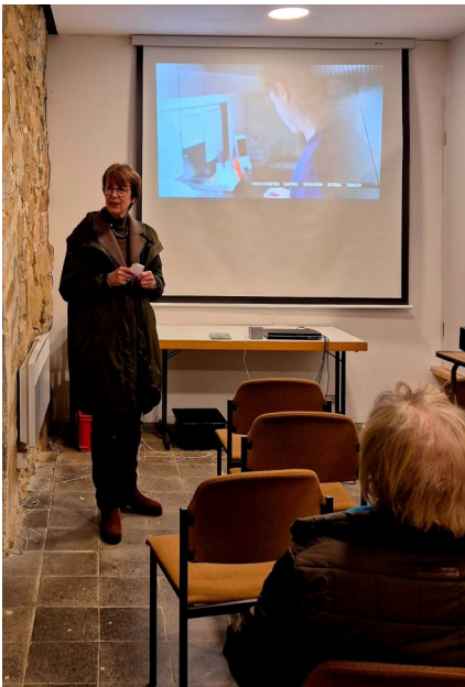
Winterabend in Ostharingen

Krippenspiele in Dörnten (rechts) und Othfresen (unten). Vielen Dank an alle, die mitgemacht haben!