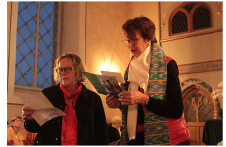
Weltgebetstag in Ostharingen mit dem Gospelchor „Praise'n colors“. Im Anschluss gab es Suppe und Reis.