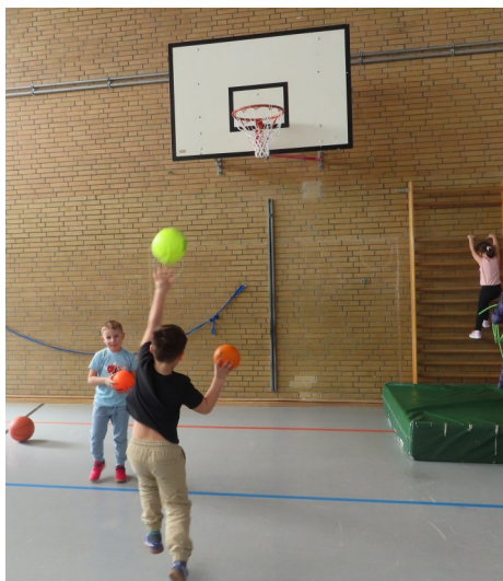
In der Turnhalle der Grundschule

Bewegung, die nicht einfach nur durch toben und im freien Spiel ausgeführt wird, sondern auch gezielt unter pädagogischer Anleitung. Wir führen Angebote durch, für die wir zum Teil geschult wurden, wie z.B. für das Angebot „Hengstenberg“. Hierfür werden Geräte und Materialien aus Holz in unterschiedlichen Höhen aufgebaut. Hier wird gebaut, geklettert, sich ausbalanciert – eigene Grenzen werden verschoben, Bewegungskoordina-