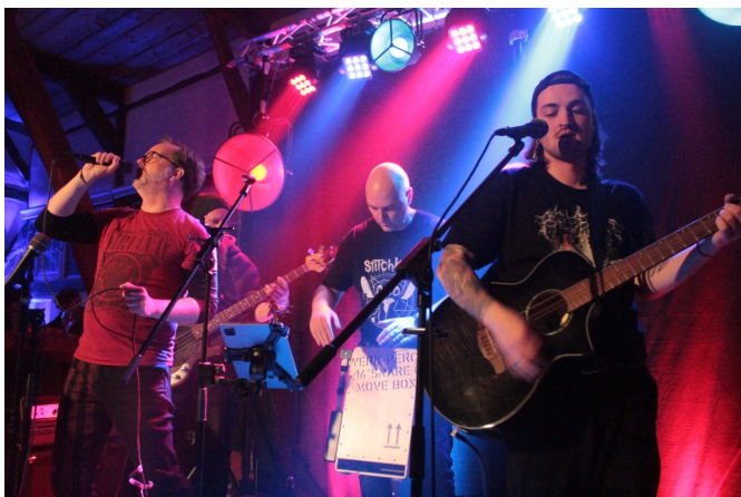
Stiffler’s Dad waren das erste Mal beim Scheunenrock

Mit 8 Bands ging es in diesem Jahr wieder hoch her in der Pfarrscheune Dörnten: „Stiffler’s Dad“ traten auf und brachten schwungvolle Mucke in die volle Pfarrscheune. Mit „OP 3“ ging es dann rockig weiter. Da zwei Bands ausgefallen waren, gilt ein großer Dank an „The Sidekicks“ und die „Old Fellaz“, die sehr spon-