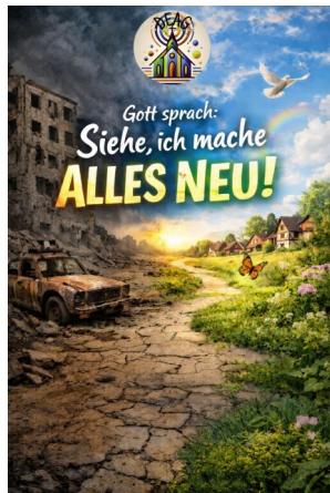
Plakat von DeaG

Und manches Neue ist echt schön: genießen Sie den Frühling und das neue Erwachen der Natur und bleiben Sie zuversichtlich!